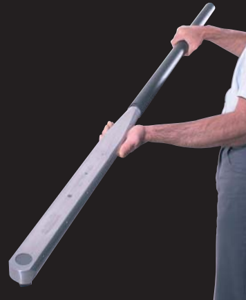
Clé dynamométrique 1" Torque wrench 1"