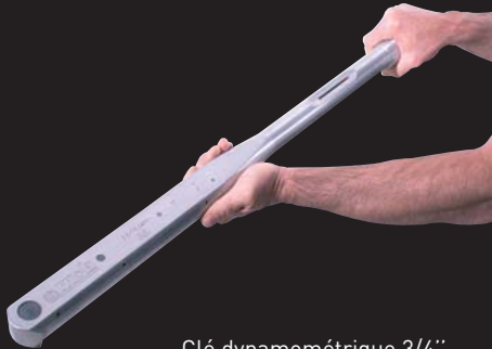
Clé dynamométrique 3/4" Torque wrench 3/4"